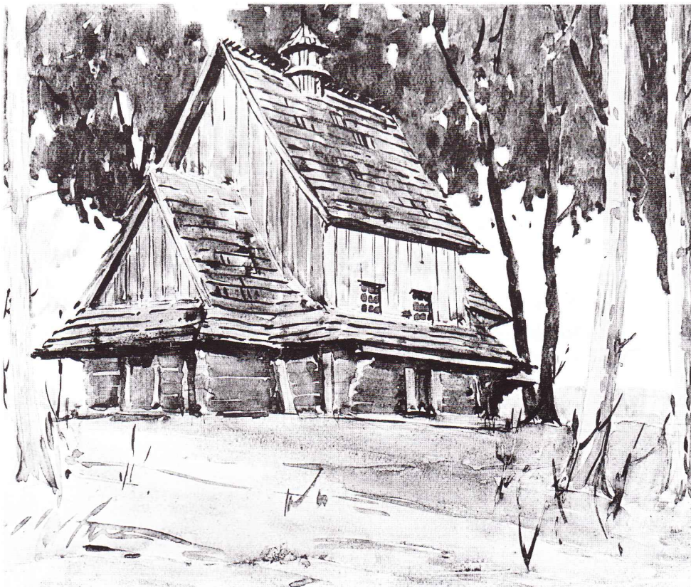
Церква Успення Пр. Богороди- ці, 1732 року. Акварель О. Годованюк, 1964 рік