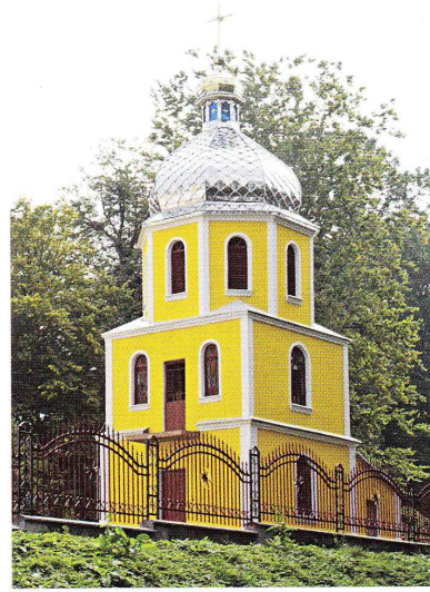
Дзвіниця нової греко-католицької церкви. Світлина І. Думи, 2011 рік

церква була збудована 1732 року 531 . Інвентар же 1830 року подає дату, як і візитатор 1761 року – 1747 рік 532 . На одвірку була зазначена дата – 1791 рік, мабуть, ремонту церкви. Візитатор 1815 року, відвідавши церкву, зазначив лише, що «в церкві підлоги немає. Парох о. Петро Бачинський» 533 .