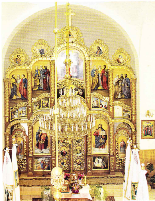
Іконостас нової греко-католицької церкви. Світлина І. Думи, 2011 рік