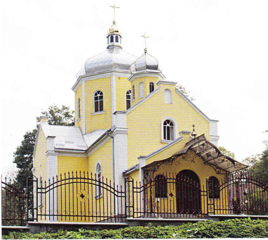
Нова греко-католицька церква. Світлина І. Думи, 2011 рік