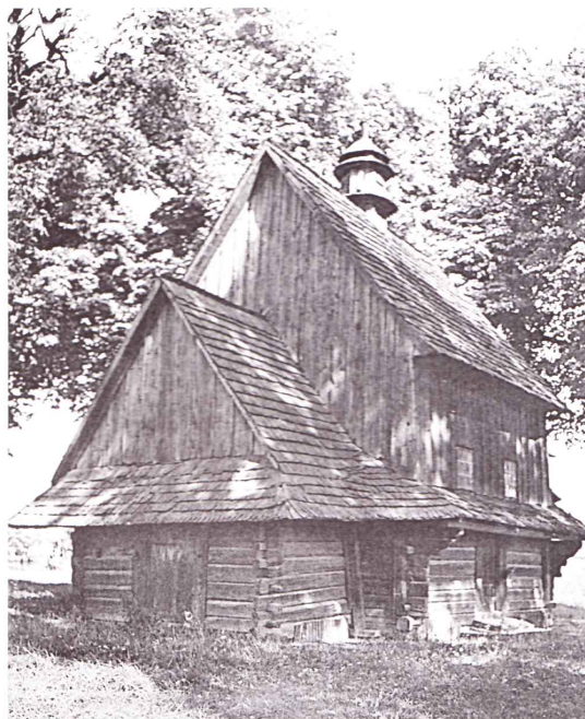
Церква Успення Пр. Богородиці, 1732 ро ку. Світлина В. Ольхом'яка, 1968 рік