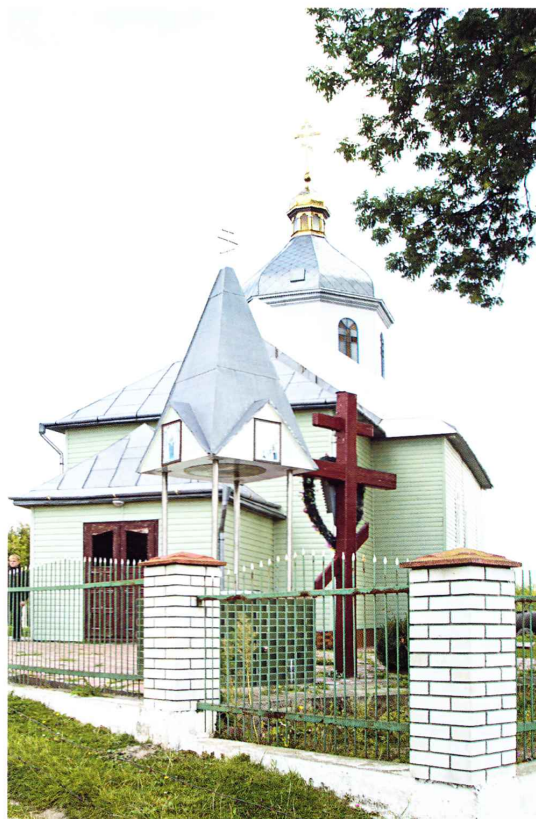
Нова православна церква Успення Пр. Богородиці. Світлина І. Думи, 2011 рік