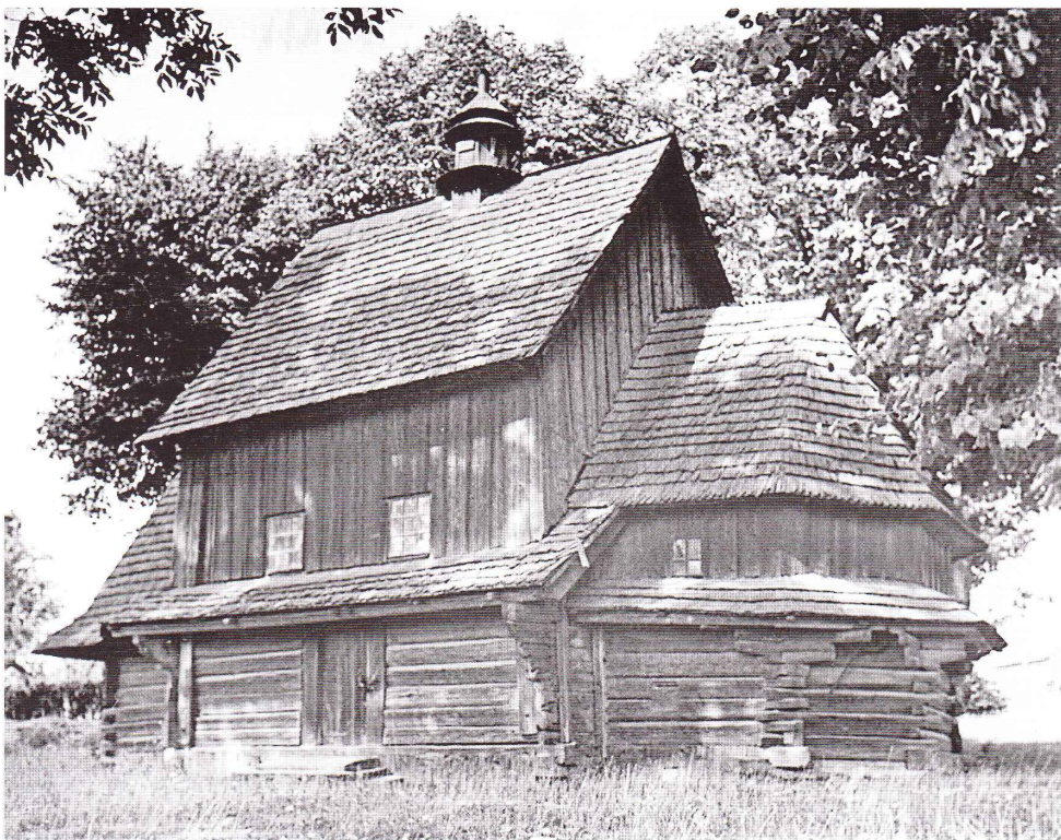
Церква Успення Пр. Богороди- ці, 1732 року. 1989 рік