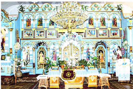
Інтер'єр нової православної церкви. Світлина І. Думи, 2011 рік