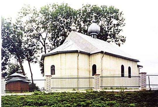
Нова православна церква Успення Пр. Богородиці. 2004 рік