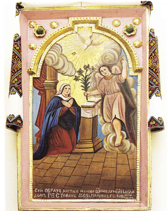
Ікона «Благовіщення Пр. Богородиці», 1888 року в новій греко-католицькій церкві. Світлина І. Думи, 2011 рік