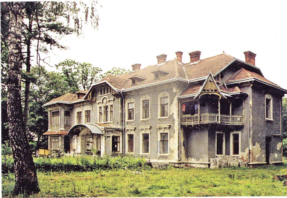
Монастир сестер студиток в колишньому палаці.